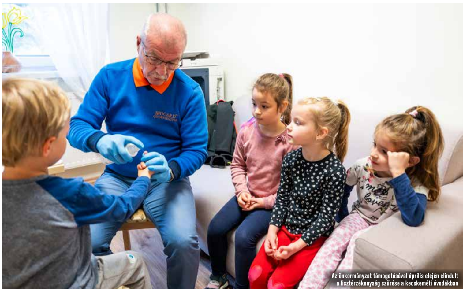
Az önkormányzat támogatásával április elején elindult a lisztérzékenység szűrése a kecskeméti óvodákban

a lisztérzékeny ember, számuk a lakosság 1-2 százalékára tehető, ráadásul – főképp a felnőttek körében – sokszor nincs még diagnosztizálva a betegség, így a lisztérzékenységben szenvedők valódi aránya ennél biztosan magasabb.