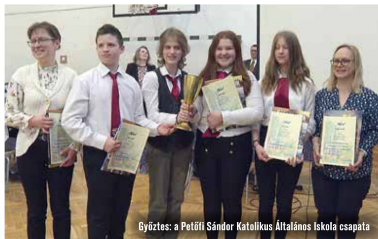
Győztes: a Petőfi Sándor Katolikus Általános Iskola csapata