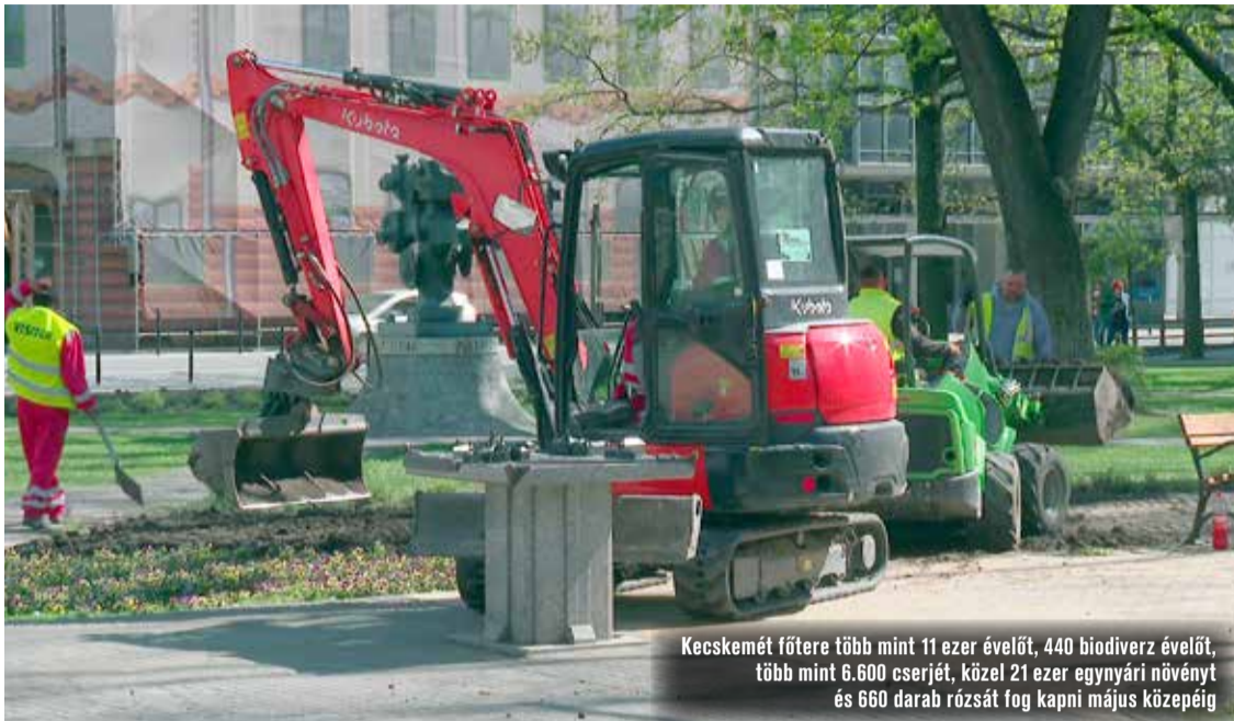
Kecskemét főtere több mint 11 ezer évelőt, 440 biodiverz évelőt, több mint 6.600 cserjét, közel 21 ezer egyenlő növényt és 660 darab rózsát fog kapni május közepéig

A szökőkutak és a zöldfelületek is megújulnak a belvárosi sétányon. A munkálatok jelenleg is zajlanak, melyek végeztével virágos, növényekkel teli, új főteret kapnak a kecskeméti, illetve az ide látogatók. A tervek szerint május közepén befejezik a rekonstrukciókat a Kecskeméti Városüzemeltetés munkatársai.