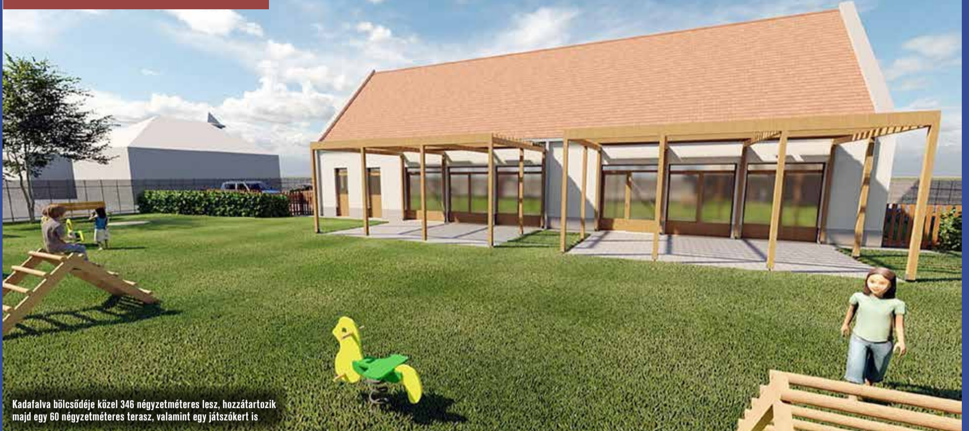
Kadafalva bölcsődéje közel 346 négyzetméteres lesz, hozzátartozik majd egy 60 négyzetméteres terasz, valamint egy játszókert is