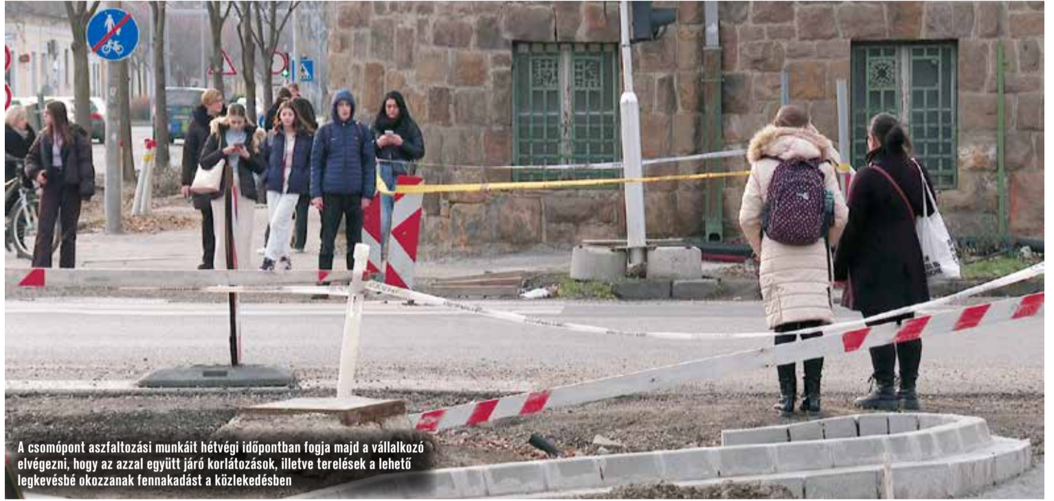
A csomópont aszfaltozási munkáit hétvégi időpontban fogja majd a vállalkozó elvégezni, hogy az azzal együtt járó korlátozások, illetve terelések a lehető legkevésbé okozzanak fennakadást a közlekedésben

A gépkocsi mellett azonban a gyalog és kerékpárral közlekedők is részesülnek a fejlesztésből, hiszen a gyalog- és kerékpárutak is átépítésre és felújításra kerülnek, illetve a jelzőlámpás forgalomirányítás számukra is biztonságossá teszi a főúton való átkelést. A 2023 nyarán bevezetett