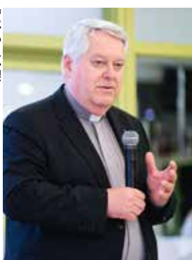
Dr. Osztie Zoltán