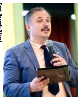
Fotó: Banczik Róbert Dr. Berényi Tivadar