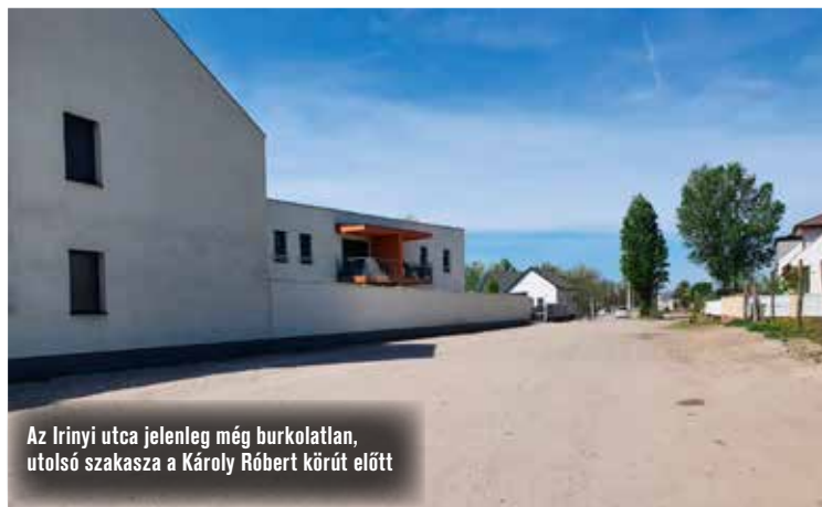
Az Irinyi utca jelenleg még burkolatlan, utolsó szakasza a Károly Róbert körút előtt

körúthoz csatlakozó körforgalomig egyelőre földút. Ennek a szakasznak a fejlesztése kulcsfontosságú lenne a környező kisebb utcákat terhelő forgalom mérséklése szempontjából.