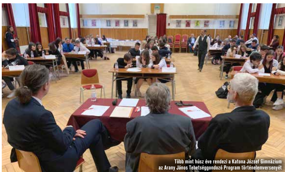
Több mint húsz éve rendezi a Katona József Gimnázium az Arany János Tehetséggyondozó Program történelemversenyét