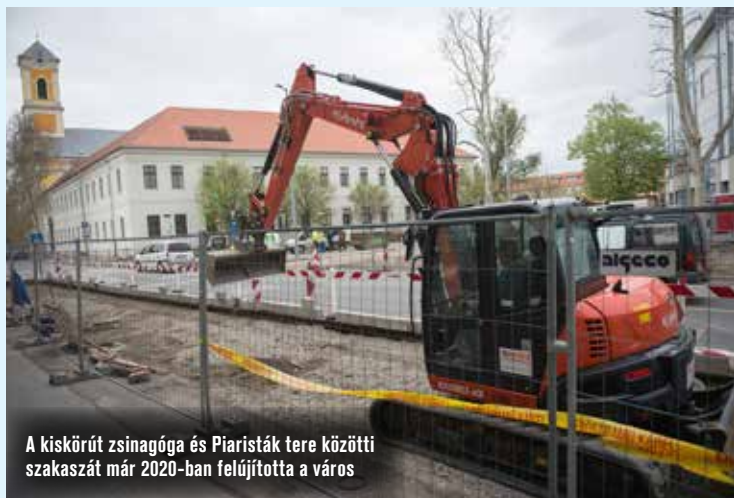
A kiskörút zsinagóga és Piaristák tere közötti szakaszát már 2020-ban felújította a város

Ebben az évben elindulhat a kiskörút és a Mátyás király krt. felújításának folytatása. Minderről Szemereyné Pataki Klaudia polgármester beszélt a Rádió 1 Gongban. Mint a műsorban elhangzott, az önkormányzat TOP Plusz-os forrásból biztosítaná a munkálatokhoz szükséges pénzt.