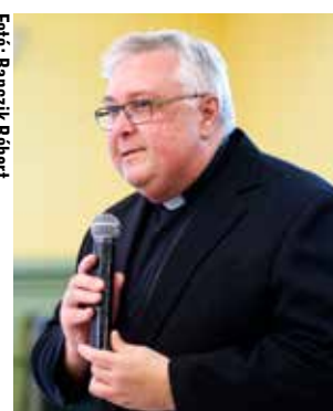
Dr. Finta József