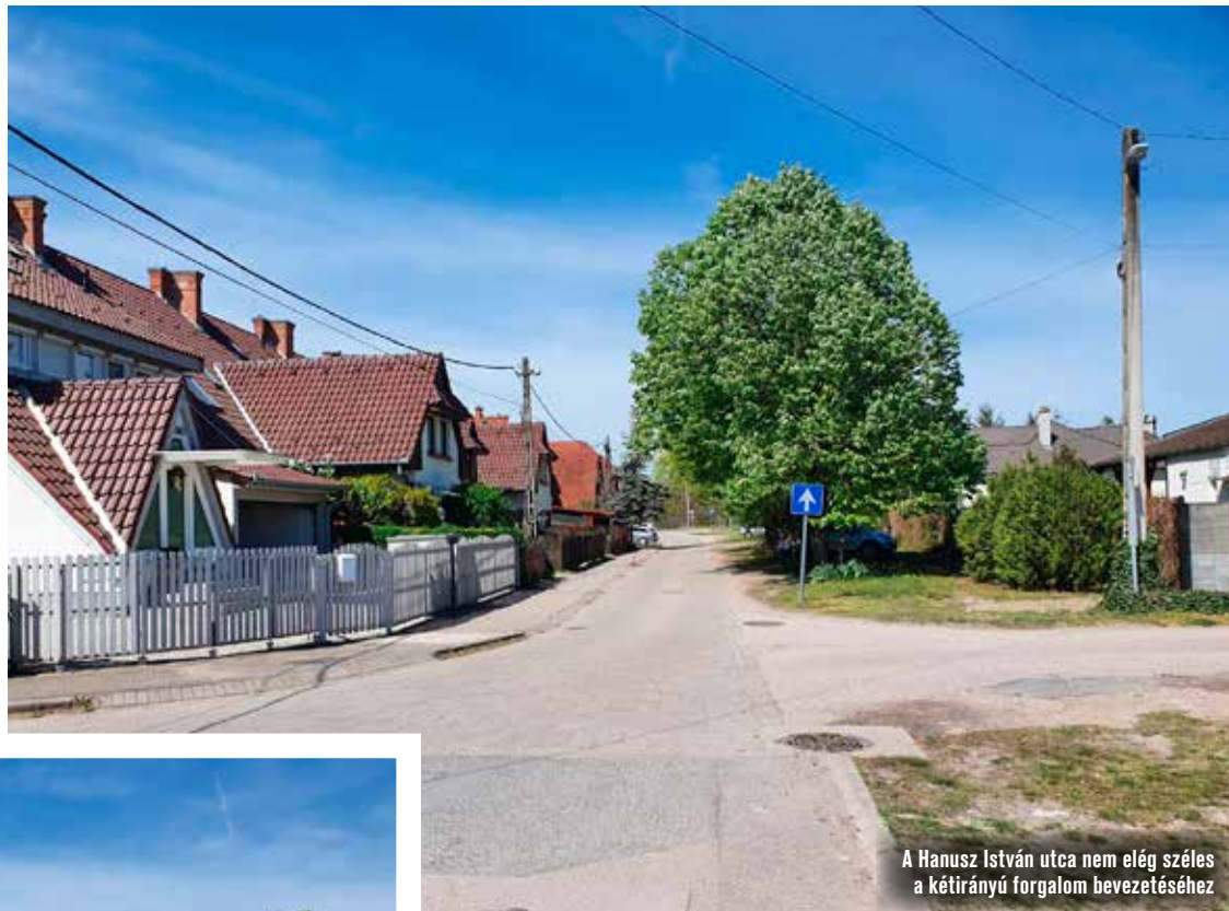
A Hanusz István utca nem elég széles a kétirányú forgalom bevezetéséhez

Az Irinyi utca az 5-ös főút bekötő szakasza (Budai utca) és a Nyíri út mellett a harmadik legfontosabb közlekedési ütőérnek számít a belváros felől a Károly Róbert körút irányába. Utolsó, 300 méteres szakasza a Bolyai János Gimnáziumtól a Károly Róbert