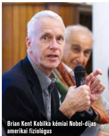
Brian Kent Kobilka kémiai Nobel-díjas amerikai fiziológus