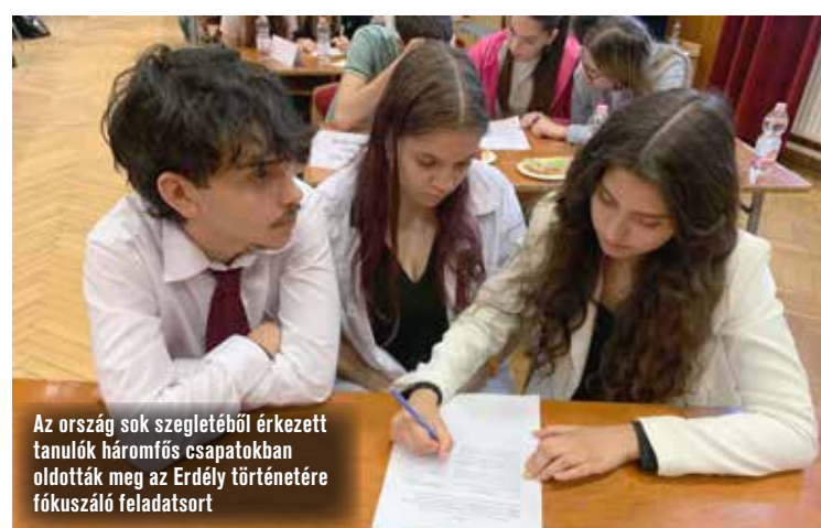
Az ország sok szegletéből érkezett tanulók háromfős csapatokban oldották meg az Erdély történetére fókuszáló feladatsort