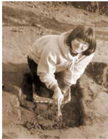
Egy Csongrád megyei ásatáson az 1970-es években