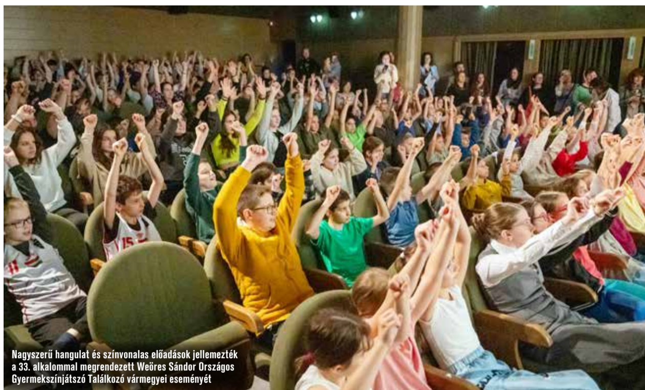
Nagyszerű hangulat és színvonalas előadások jellemezték a 33. alkalommal megrendezett Weöres Sándor Országos Gyermekszínház Találkozó vármegyei eseményét