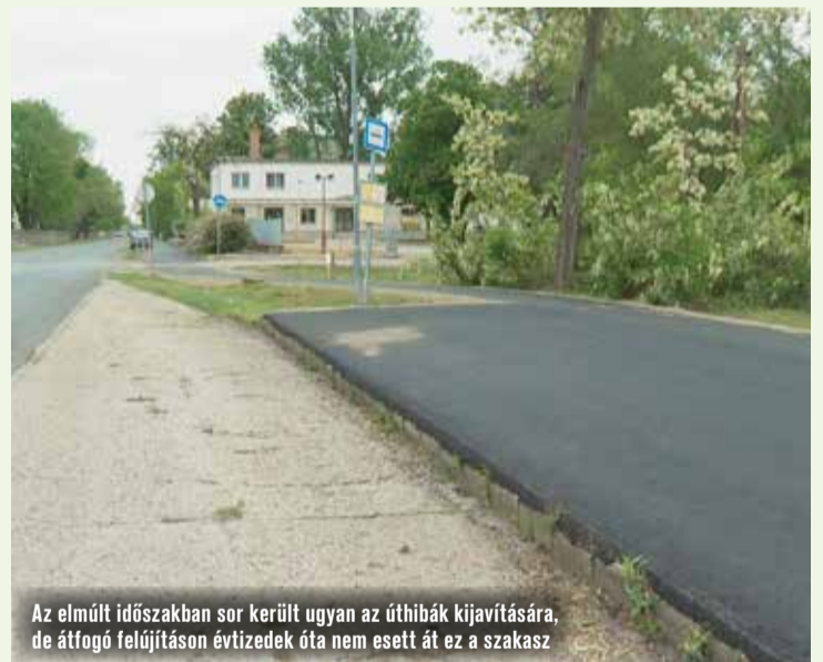
Az elmúlt időszakban sor került ugyan az úthibák kijavítására, de átfogó felújításon évtizedek óta nem esett át ez a szakasz

A munkálatok első üteme április 15-én vette kezdetét, és körülbelül egy hét alatt le is zárult a felület aszfaltozásával. A második ütemben zajló padkaépítés a május 6-ai hét kezdetére fejeződik be – tájékoztatta lapunkat a kivitelező. Ez utóbbi folyamat alatt szakaszos útlezárásra számíthatnak a kerékpárosok.