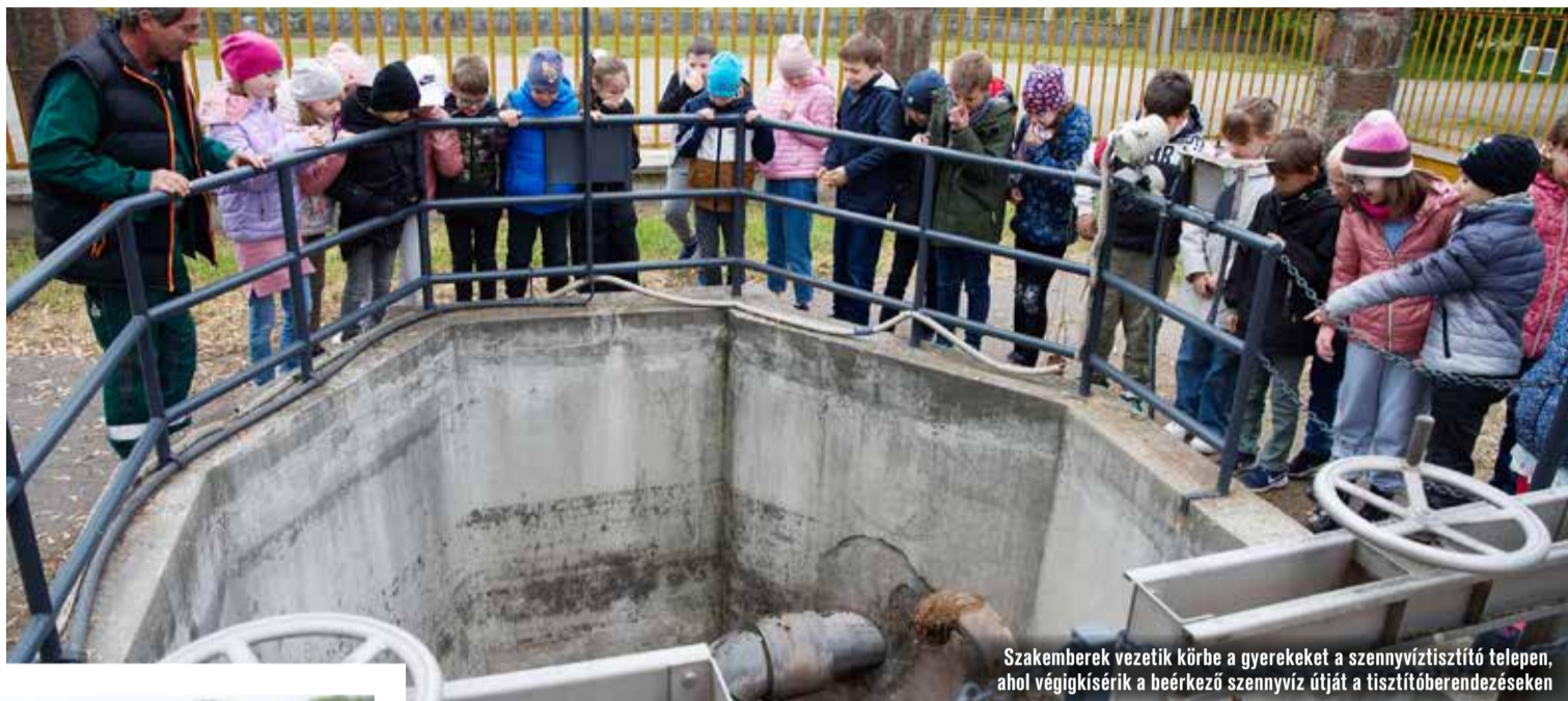
Szakemberek vezetékörbe a gyerekeket a szennyvíztisztító telepen, ahol végigkísérik a beérkező szennyvíz útját a tisztítóberendezéseken