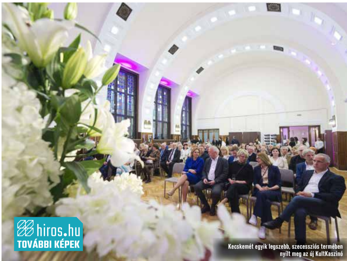
Kecskemét egyik legszebb, szecessziós termében nyílt meg az új KultKaszinó