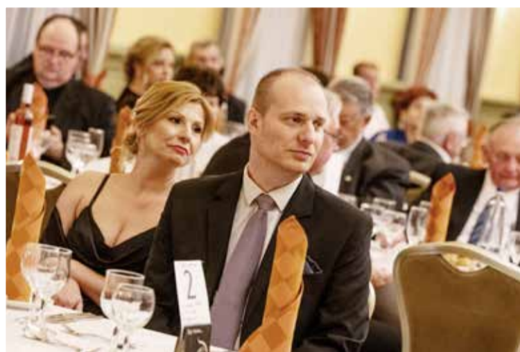
A Három Gúnár Rendezvényház terme teljesen megtelt április 20-án este, a Kecskeméti Római Katolikus Főplébánia, a Keresztény Értelmisségiek Szövetségének Kecskeméti Szervezete, a Magyar Máltai Szeretetszolgálat Kecskeméti Csoportja és a Piarista Diákszövetség közös bálján

Csoportja és a Piarista Diákszövetség közös bálján.