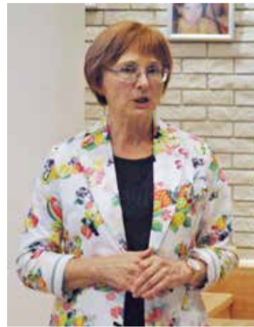
Rejtett kincsek nyomában címmel tartott előadást a könyvtárban 2018-ban

Solt környékén található, a középső bronzkor időszakából származó erődített és nyílt színi telepek szerepéről írtam egy hosszabb cikket.