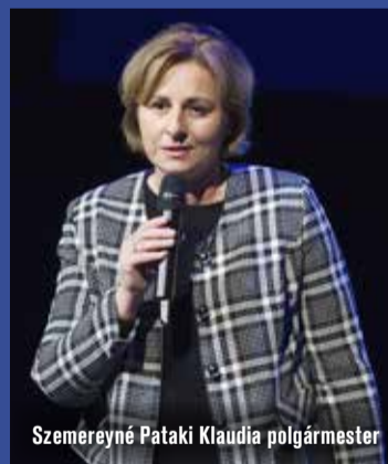
Szemereyné Pataki Klaudia polgármester