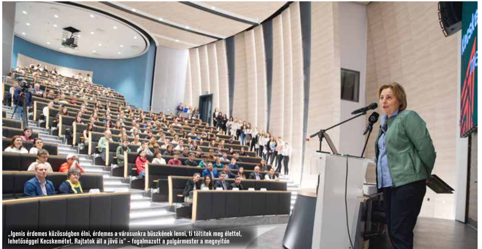
„Igenis érdemes közösségben élni, érdemes a városunkra büszkének lenni, ti töltitek meg élettel, lehetőséggel Kecskemétet. Rajtatok áll a jövő is” – fogalmazott a polgármester a megnyitón