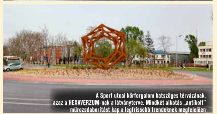
A Sport utcai körforgalom hatszöges térvázának, azaz a HEXAVERZUM-nak a látványterve. Mindkét alkotás „antikolt” műrozsdaborítást kap a legfrissebb trendeknek megfelelően