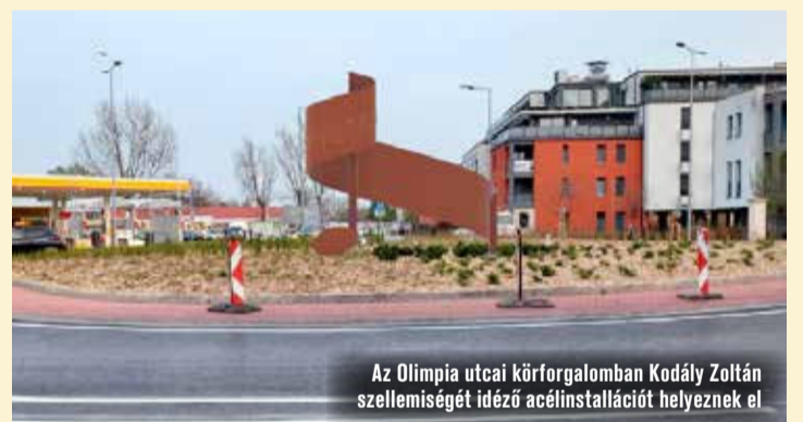
Az Olimpia utcai körforgalomban Kodály Zoltán szellemiségét idéző acélinstallációt helyeznek el

Acélművészeti installációt helyeznek el a KÉSZ Holding Zrt. felajánlásának köszönhetően az Izsáki úton, a Sport utcai, illetve az Olimpia utcai körforgalom középszigetében. A közterületi alkotások elkészítésére, koordinálására a KARTS Művészeti Alapítványt és Árvai István művészeti vezetőt kérték fel. Az Olimpia utcai körforgalomban egy Kodály Zoltán szellemiségére emlékeztető acélinstallációt terveznek, a Sport utcai körforgalomba pedig egy hatszöges térváz, azaz egy HEXAVERZUM kerülne, amely az acélszobrászati hagyomány és a fémmunkás ipartörténetre, a mérnöki tudásra hívna fel a figyelmet. A KÉSZ Holding Zrt. a műalkotásokat az önkormányzatnak ajánlódózza, ezek értéke a tervezéssel, kivitelezéssel, illetve a szállítással együtt mintegy ötven millió forint.