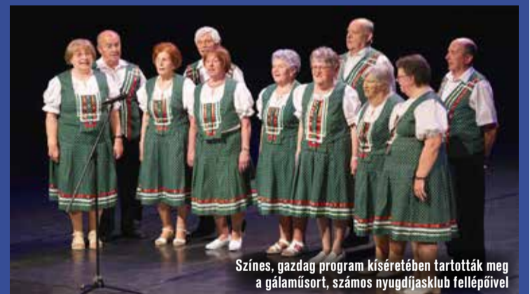
Színes, gazdag program kíséretében tartották meg a gálaműsort, számos nyugdíjasklub fellépőivel