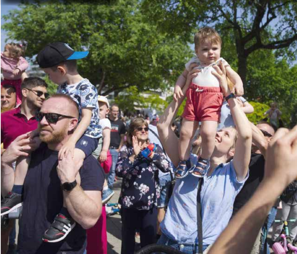
A 10. Születésünnepén az országos flashmobhoz csatlakozva pontban 11 órakor magasba emelkedtek a gyerkőcök