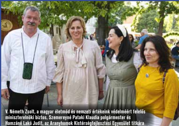
V. Németh Zsolt, a magyar életmód és nemzeti értékeink védelméért felelős miniszterelnöki biztos, Szemereyné Pataki Klaudia polgármester és Hamzáné Lakó Judit, az Aranyhomok Kistérségfejlesztési Egyesület titkára