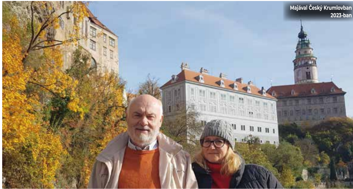
Majával Český Krumlovban 2023-ban