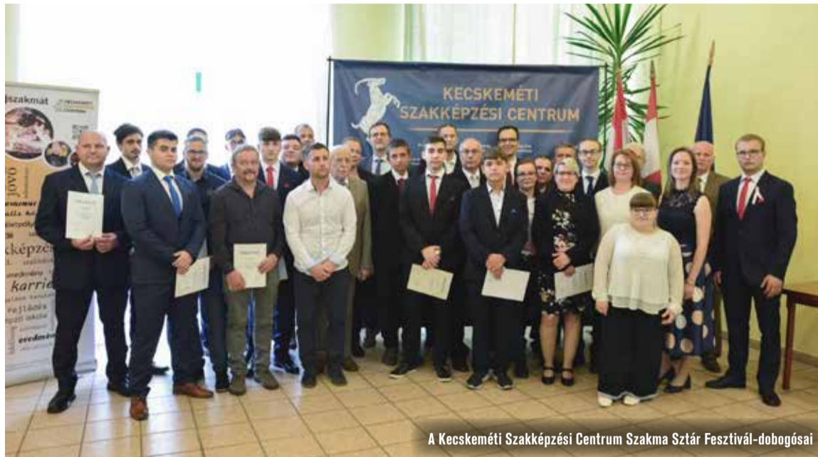
A Kecskeméti Szakképzési Centrum Szakma Sztár Fesztivál-dobogósai

A legerősebb mezőnyt a szerzőkészítő és gépészet, valamint az épület- és szerkezetlakatos szakmák képviselői adták. A háromnapos döntő feladatai gyakorlati és írásbeli feladatokból álltak, amit időre kellett teljesíteniük a versenyzőknek.