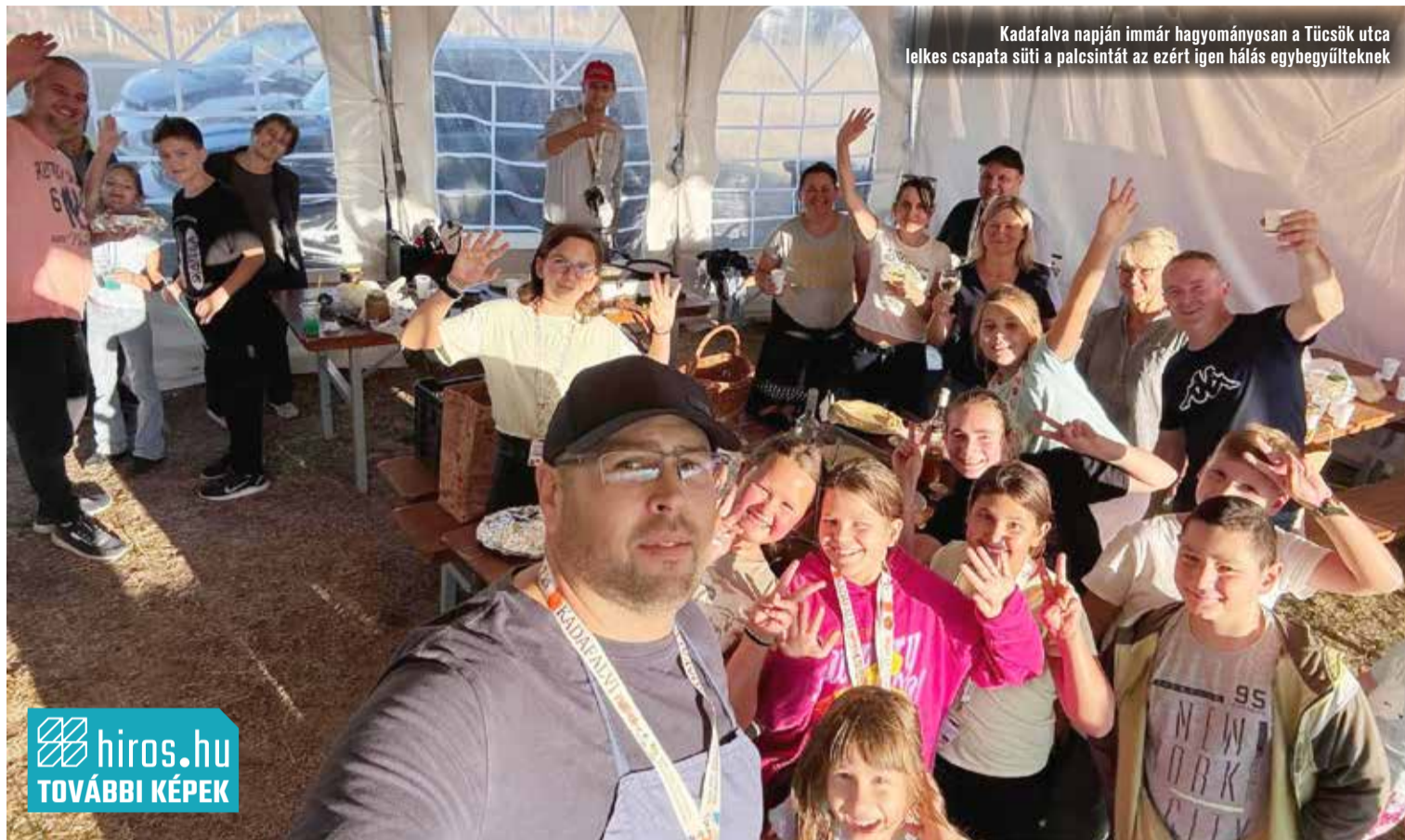
Kadafalva napján immár hagyományosan a Tücsök utca lelkes csapata süti a palacsintát az ezért igen hálás egybegyűlteknek

Hagyományörző katonák puskalövésével szeptember 20-án 18 órakor rajtolt el a 10. jubileumi 24 órás futás az alsószéktői Melinda parkban. Az egyre népszerűbb programhoz iskolák, családok, fiatalok és szépkorúak csatlakoztak. A jelenlévőket Jánosi