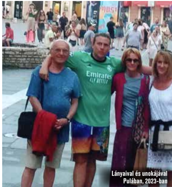
Lányaival és unokájával Pulában, 2023-ban