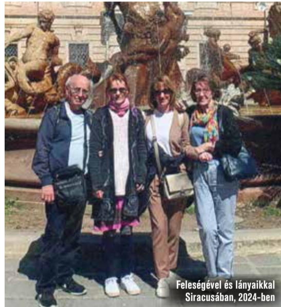
Feleségével és lányaikkal Siracusában, 2024-ben