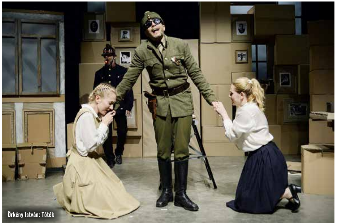
Örkény István: Tóték

Az évek során sokféle játék várta a gyerekeket. Ezek közül az egyik legkedveltebb a varázsigék gyűjtögetése volt, melyek kimondásával olyan helyszínekre léphettek be, mint a Kecskeméti Fürdő vagy épp a Kecskeméti Vadaspark. A tavalyi Mesébelépő is a kedvencek közé tartozott: izgalmas