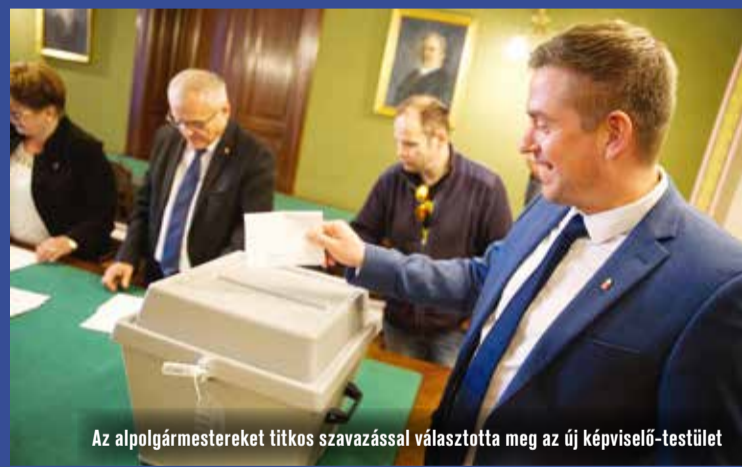
Az alpolgármestereket titkos szavazással választotta meg az új képviselő-testület

Az alakuló közgyűlésről szóló bővebb cikkeink hírportálunkon, a Hírös.hu oldalon olvashatóak.