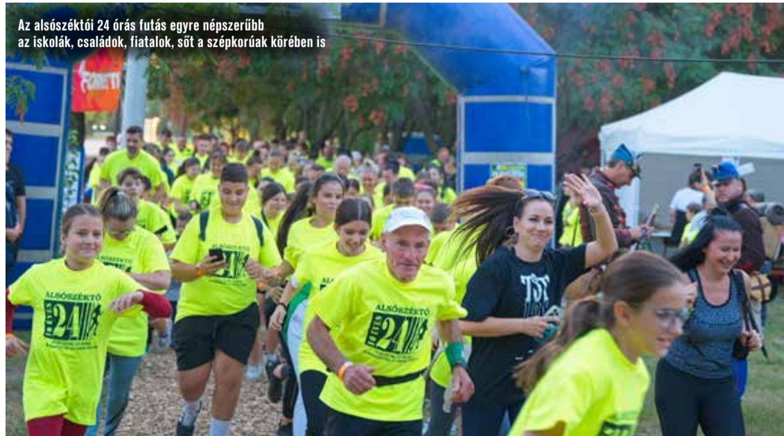
Az alsószéktői 24 órás futás egyre népszerűbb az iskolák, családok, fiatalok, sőt a szépkorúak körében is

Szombaton késő estig várták a városrész apraja-nagyját a közösségi térre. A hagyományok szerint lovas kocsis zenés ébresztővel indult a nap, ezzel párhuzamosan kezdetét vette a kakaspörkölt főzőverseny is, amelyre idén 24 csapat nevezett. Idén is megrendezték a közösségi futást, a színpadon pedig egymást váltották a műsorok. Estére fantasztikus hangulat kerekedett. A Crazy Little Queen Tribute Band fellépése óriási sikert aratott. Koncertjük után DJ Gázsó retró házbiliájával ért véget a XIII. Kadafalvi Napok.