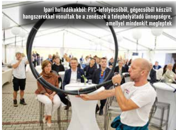
Ipari hulladékokból: PVC-lefolyócsőből, gégecsőből készült hangszerekkel vonultak be a zenészek a telephelyátadó ünnepségre, amellyel mindenkit megleptek