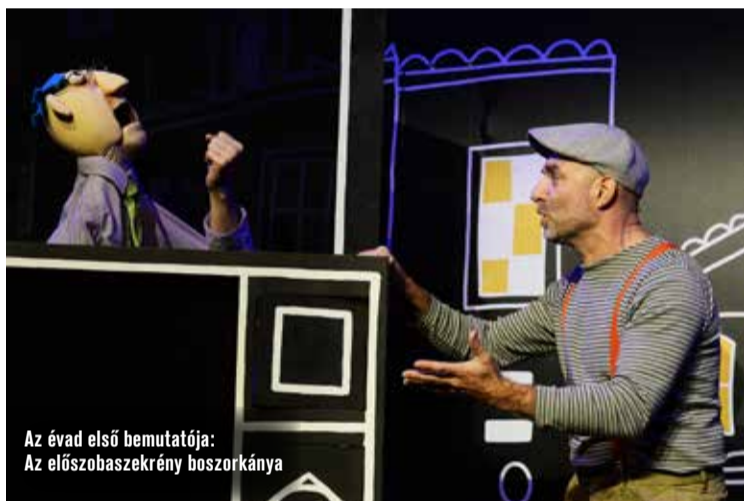
Az évad első bemutatója: Az előszobaszekrény boszorkánya

nyomozás során derült fény városunk történetéhez kapcsolódó sok érdekességre. A 2024/25-ös évadban a mesék birodalmába invitál a játék. „Ahhoz, hogy útnak indulj, BÁTORSÁG kell. NYITOTTSÁG a felfedezésre, HIT, hogy célba érsz. Szívedben legyen SZERETET. Légy SEGÍTŐKÉSZ azzal, aki rászorul, BIZALOMMAL állj a kihívások elé. Legfőképp légy TISZTELET minden iránt! KITARTÁSSAL végül megleled, amiért elindultál” – olvasható az útlevelel elején, útravalóként.