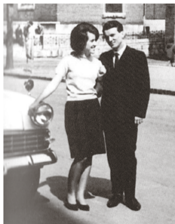
Feleségével egyetemi éveik végén Szegeden, a Dóm téren