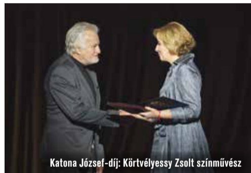
Katona József-díj: Körtvélyessy Zsolt színművész