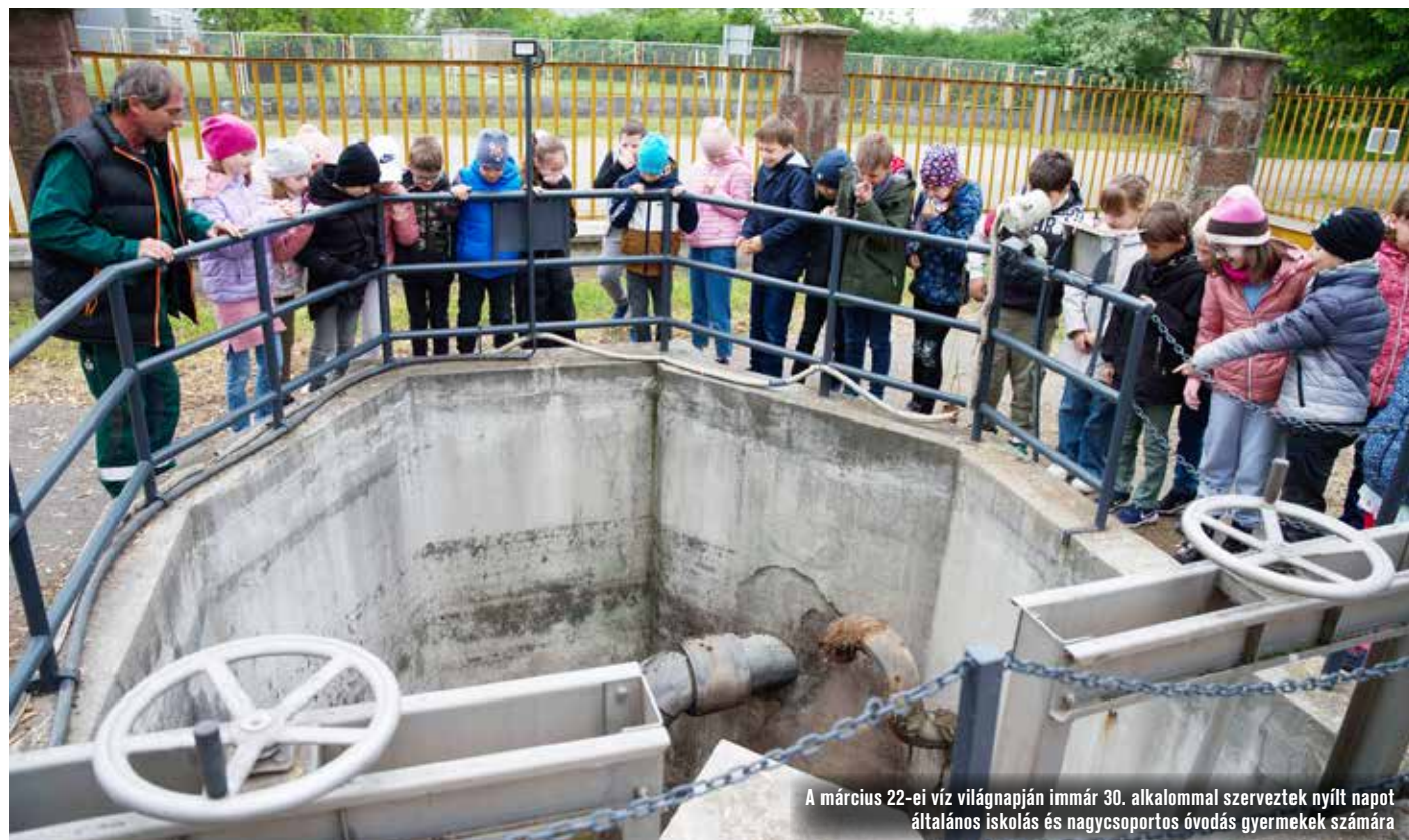
A március 22-ei víz világnapján immár 30. alkalommal szerveztek nyílt napot általános iskolás és nagycsoportos óvodás gyermekek számára