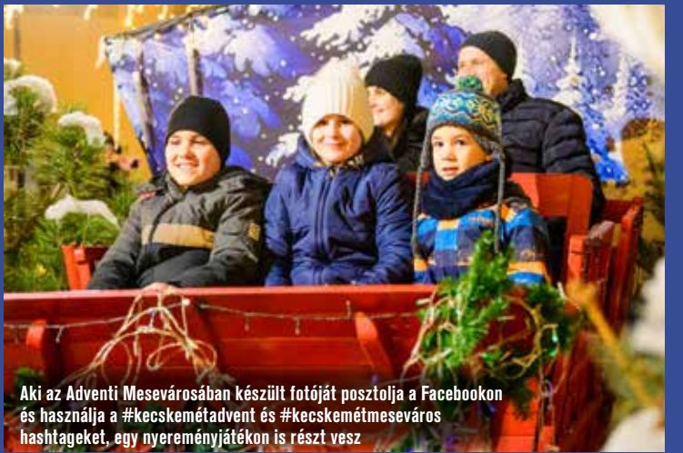
Aki az Adventi Mesevárosában készült fotóját posztolja a Facebookon és használja a #kecskemétadvent és #kecskemétmeseváros hashtageket, egy nyereményjátékon is részt vesz

udvarának Mesevárosa ámulatba ejtette az arra járókat. Itt ugyanis a mesék varázslatos világa várja a gyermekeket, családokat egészen december 31-ig. A Círóka Bábszínház munkatársai álmodták meg és építették fel azt a fantáziadús,