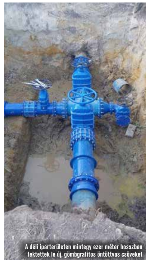
A déli iparterületen mintegy ezer méter hosszban fektettek le új, gömbrgrafitos öntöttvas csöveket