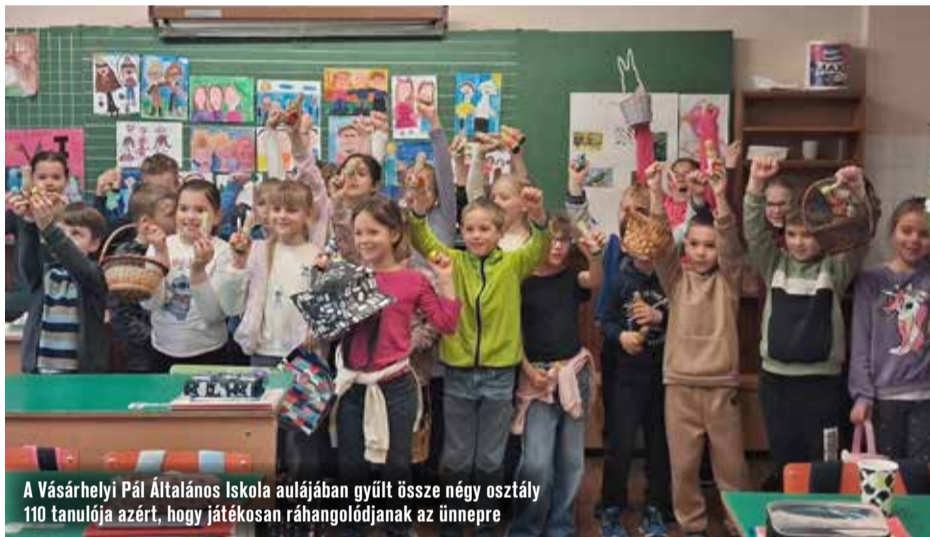
A Vásárhelyi Pál Általános Iskola aulájában gyűlt össze négy osztály 110 tanulója azért, hogy játékosan ráhangolódjanak az ünnepre