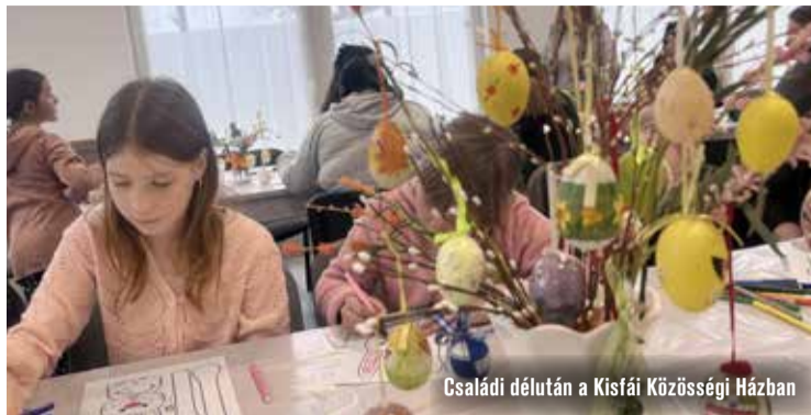
Családi délután a Kisfai Közösségi Házban

Egész napos programkavalkád várta a családokat március 28-án Homokbányán. A BringaParkban megrendezett családi napon a borús idő sem szegte kedvét a résztvevőknek – már kora reggel rotyogtak a bográcsok. A programot a Homokbánya Egyesület és az Egészséges Életmóddért Hit és Sport Alapítvány szervezte azzal a céllal, hogy közösséget építsenek és élményt adjanak a városrészt lakóinak.