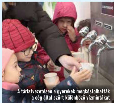
A tárlatvezetésen a gyerekek megkóstolhatták a cég által szűrt különböző vízmintákat

Március 20-án zárult a víz világnapja alkalmából szervezett programsorozat a Bácsvíz Zrt.-nél. Több iskolás és óvodás csoport is meglátogatta a cég II. számú vízműtelepét, ahol a Bácsvíz szakemberei vezették körbe a csoportokat. A fiatalok ezáltal betekintést nyerhettek a víz útjába és a vízellátás világába. A program során interaktív feladatokkal és oktatóvideókkal mutatták be a víz fontosságát és tudatos használatát. Ezzel az volt a céljuk, hogy fejlesszék a különböző korcsoportok felelősségvállalását a takarékos vízfelhasználással és a víz-bázisvédelemmel kapcsolatban.