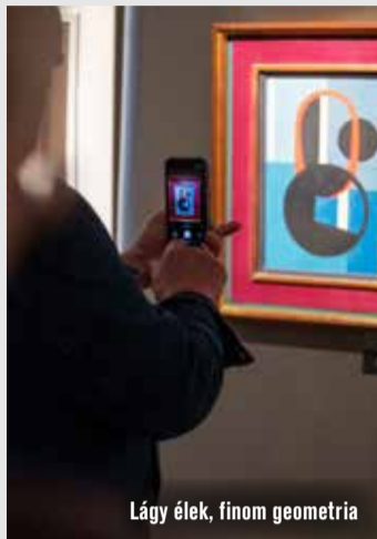
Lány élek, finom geometria

Kecskeméti Hírös Agóra Kulturális Központ. Tel.: +36 76/503-880 www.hirosagora.hu