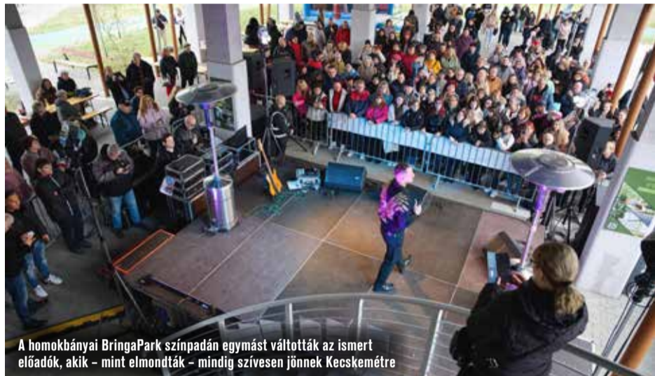
A homokbányai BringaPark színpadán egymást váltották az ismert előadók, akik – mint elmondták – mindig szívesen jönnek Kecskemétre