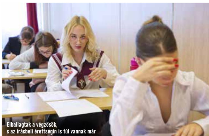
Elballagtak a végzősök, s az írásbeli érettségén is túl vannak már

Az idei érettségi vizsgaidőszak május 4-én kezdődött magyar nyelv és irodalom tantárgyból. A középszintű írásbeli feladatsor első részében egy ismeretterjesztő szöveget, publicisztikai művet, vagy annak egy részletét kellett elolvasniuk a vizsgázóknak és megoldani az azokkal kapcsolatos feladatokat. Az idei tesztben pedig szerepelt szóképekkel kapcsolatos feladat és versrészletek sorba rendezése, valamint művek szereplőit is ki kellett találni. Ezen kívül egy Wass Alberttel, Herczeg Ferencsel kapcsolatos kérdést is kaptak a vizsgázók és egy megadott vers stílusirányzatának, rímelésének felismerése is feladat volt. Május 5-én a matematika írásbelivel