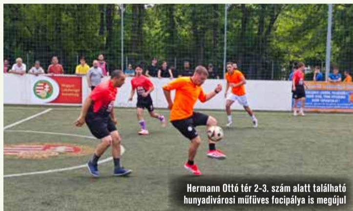
Hermann Ottó tér 2-3. szám alatt található hunyadi városi műfüves focipálya is megújul

Kecskeméten további három, már meglévő műfüves futballpályát is felújítanak még ebben az évben. A pályák 2016-ban épültek, de állapo-