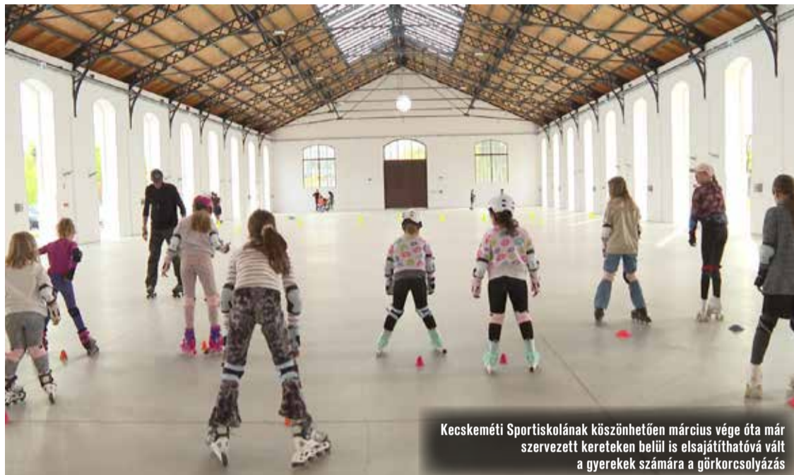
Kecskeméti Sportiskolának köszönhetően március vége óta már szervezett kereteken belül is elsajátíthatóvá vált a gyerekek számára a görkorcsolyázás