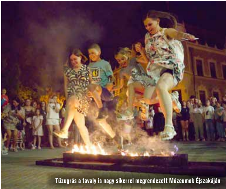
Tűzgrás a tavaly is nagy sikerrel megrendezett Múzeumok Éjszakáján