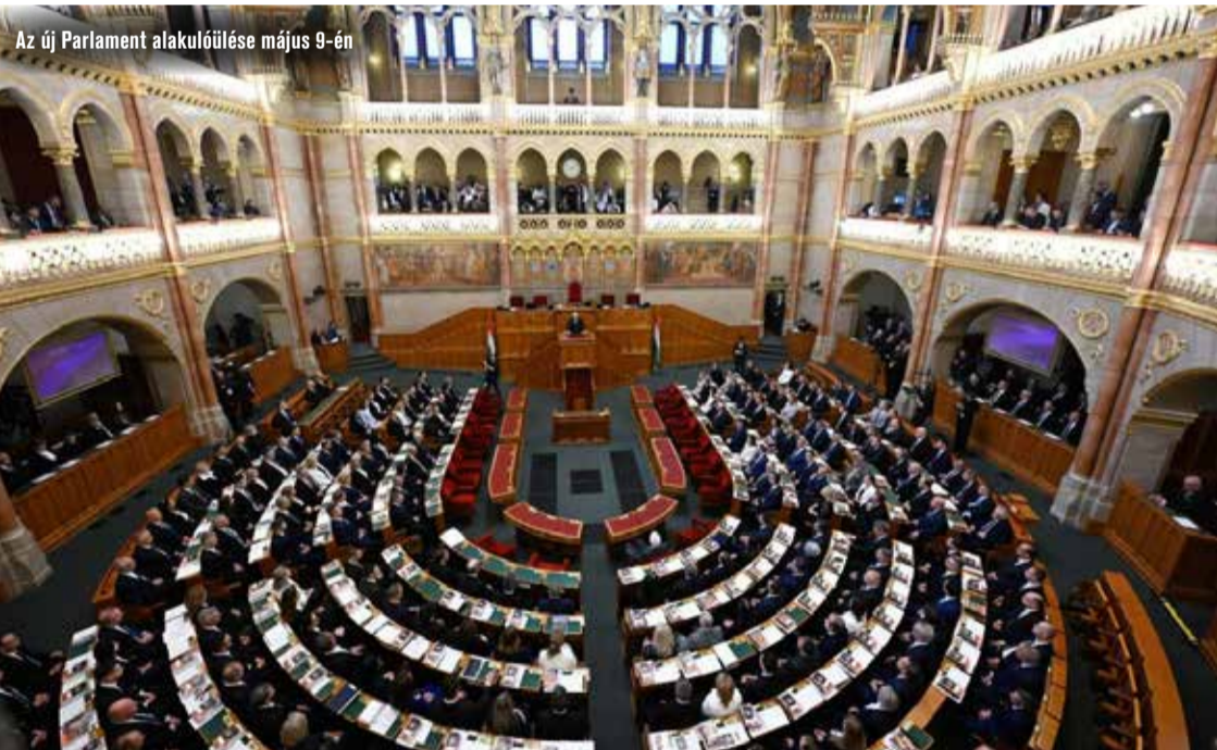
Az új Parlament alakulóülése május 9-én

Az áprilisi választás eredményeként a TISZA Párt történelmi, 141 fős kétharmados többséget szerzett az Országgyűlésben. Az új parlament megalakulásával megszűnt a 2022-ben hivatalba lépett, Orbán Viktor vezette kormány megbízatása is.